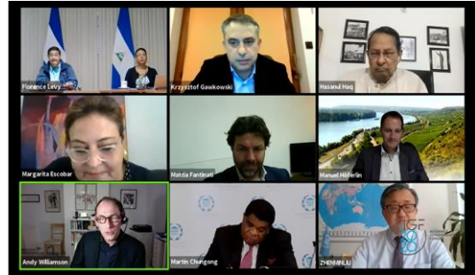
Sessão parlamentar do IGF 2020, realizada on-line

A reunião anual do IGF reúne membros de parlamentos de diferentes partes do mundo ao redor de uma mesma mesa para trocar opiniões sobre um tópico de interesse comum. A participação de parlamentares por meio de IGFs nacionais e regionais é uma excelente preparação para a compreensão do processo e trazer contribuições específicas de comunidades multissetoriais nacionais ou regionais, para o nível global de governança da Internet em questões relevantes.