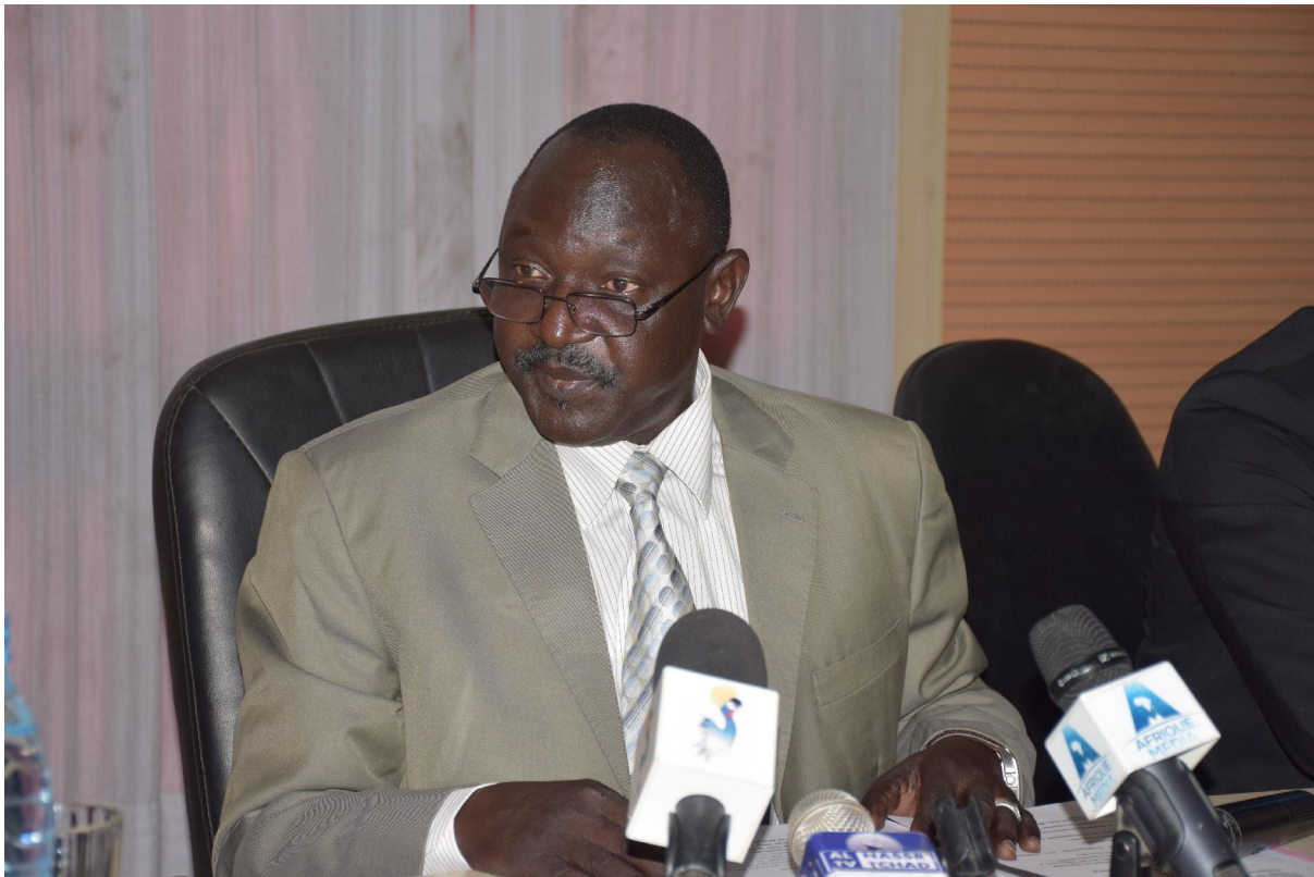
Photo : le Secrétaire Général du Ministère, représentant du Ministre des postes et TIC(MPNTIC)

Après le mot de bienvenue des uns et des autres, fut le tour des interventions directes en téléconférence.