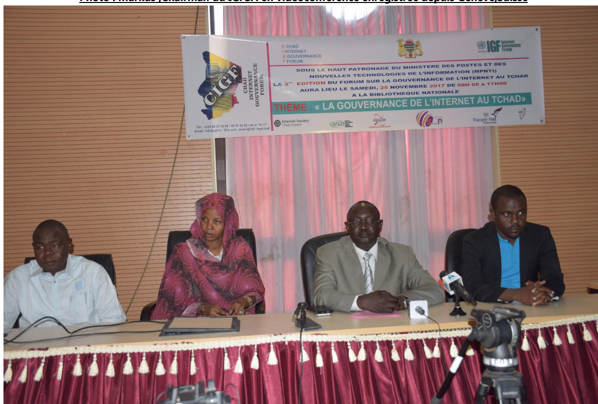
Photo de cérémonie d'ouverture avec le SG du Ministère MPNTIC