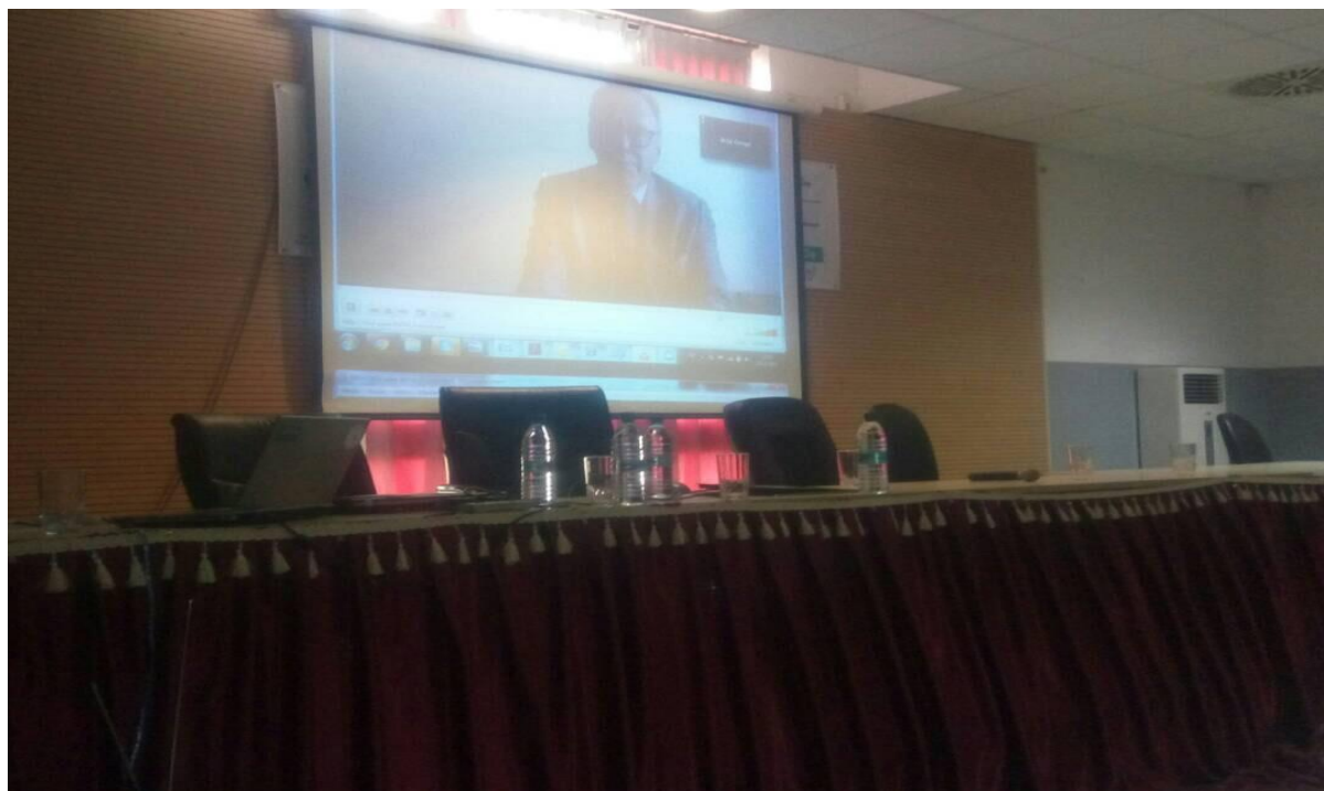
Photo : Markus ,Chairman du IGFA en vidéoconférence enregistrée depuis Geneve,Suisse