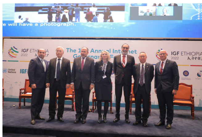
Speakers at the UN Forum