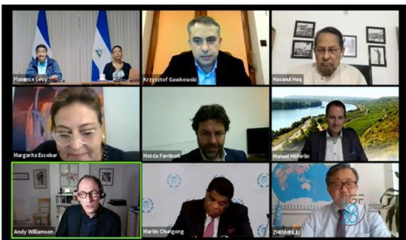
Sessione parlamentare all'IGF 2020, ospitata online

Il percorso parlamentare all'IGF è di solito organizzato in collaborazione tra il Dipartimento delle Nazioni Unite per gli Affari economici e sociali (UN DESA) con il Segretariato dell'IGF, l'Unione Inter-Parlamentare (IPU) e il Paese ospitante.