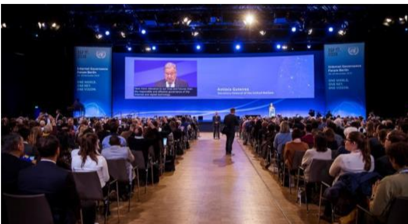
IGF 2019 a Berlino: Apertura da parte del segretario generale delle Nazioni Unite e del cancelliere tedesco

Tra le due riunioni annuali dell'IGF, la comunità lavora su diverse attività sostanziali e le discute alla riunione annuale dell'IGF. Queste includono tipicamente i forum sulle migliori pratiche, la coalizione dinamica e le reti politiche focalizzate su una particolare questione di governance di Internet. Il loro lavoro si sviluppa anche attraverso consultazioni attive con la comunità e invita tutti a contribuire.