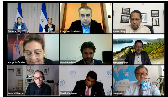
Parliamentary Session at IGF 2020, hosted online

La participation des parlementaires aux FGI nationaux et régionaux est une excellente préparation pour comprendre le processus et pour apporter des contributions spécifiques des communautés multipartites aux niveaux national ou régional, au niveau mondial de la gouvernance de l'Internet sur des questions de fond. Le volet parlementaire du FGI est généralement organisé en collaboration entre le Département des affaires économiques et sociales des Nations Unies (UN DESA), le secrétariat du FGI, l'Union interparlementaire (UIP) et le pays hôte.