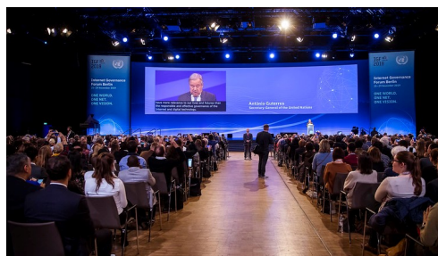
Ouverture du FGI 2019 par le Secrétaire Général des NU et la Chancelière Allemande

Le FGI suit un processus annuel comprenant des réunions et des activités intersessions. Chaque année, la réunion annuelle du FGI rassemble des parties prenantes du monde entier pour discuter de certaines des questions les plus urgentes en matière de gouvernance de l'Internet. Les participants représentent