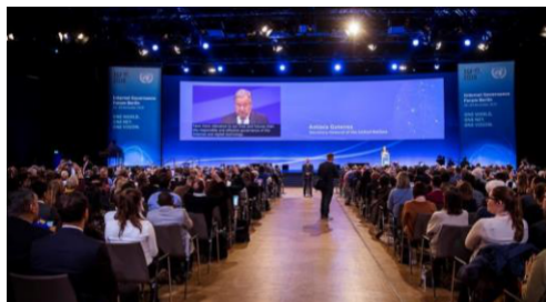
IGF 2019 v Berlíně: Zahájení generálním tajemníkem OSN a německou kancléřkou

IGF funguje jako celoroční proces zahrnující výroční zasedání a činnosti mezi zasedáními. Na výročním zasedání IGF se každoročně scházejí zúčastněné strany z celého světa, aby projednaly některé z nejnaléhavějších otázek správy internetu. Účastníci zastupují vlády, mezivládní organizace, soukromý sektor, technickou komunitu a občanskou společnost. Program zasedání se vytváří interaktivně díky aktivnímu zapojení všech zúčastněných stran.