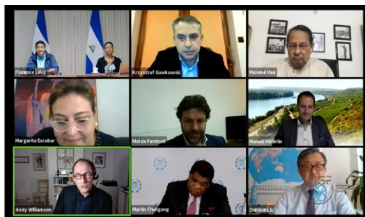
Сесија са парламентарцима на ИГФ 2020

Годишњи IGF састанак окупља чланове парламента из разних делова света. Дискусије се воде по принципу округлог стола о темама које су од заједничког интереса учесницима. Учествовање парламентарца на националним и регионалним IGF-овима је одлична припрема за учешће на глобалном нивоу првенствено због ближег упознавања са структуром и механизмом деловања, као и због разумевања природе доношења конкретних проблема локалних заједница кроз процес више заинтересованих страна, те њихово презентовање на глобалном нивоу.