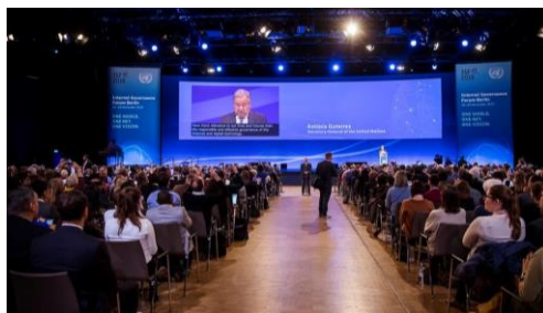
IGF 2019 u Berlinu: Otvaranje od strane UN Generalnog Sekretara i Njemačke Kancelarke

IGF funkcionira kao kontinuiran proces koji se sastoji od dvije glavne komponentne: godišnji forum i međusesijske aktivnosti (eng. intersessional work ).