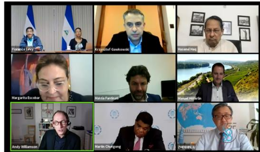
IGF 2020 Sesija sa parlamentarcima

Godišnji IGF sastanak okuplja članove parlamenata iz raznih dijelova svijeta. Diskusije se vode po principu okruglog stola o temama koje su od zajedničkog interesa učesnicima. Učestvovanje parlamentaraca na nacionalnim i regionalnim IGF-ovima je odlična priprema za učešće na globalnom nivou prvenstveno zbog bližeg upoznavanja sa strukturom i mehanizmom djelovanja, kao i zbog razumijevanja prirode konkretnih problema lokalnih zajednica kroz proces više zainteresovanih strana te njihovo prezentovanje na globalnom nivou.