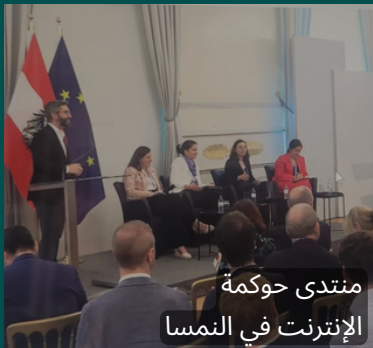
منتدى حوكمة الإنترنت في هولندا