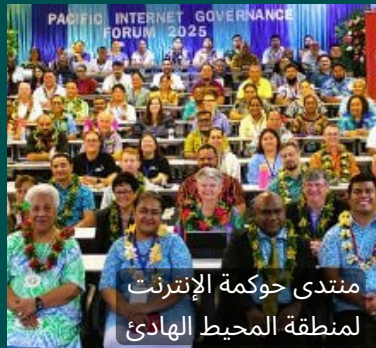
منتدى حوكمة الإنترنت لمنطقة المحيط الهادئ