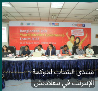
منتدى الشباب لحوكمة الإنترنت في بنغلاديش