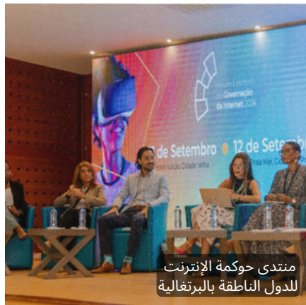
منتدى حوكمة الإنترنت للدول الناطقة بالبرتغالية