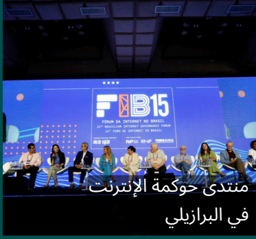
منتدى حوكمة الإنترنت في البرازيل