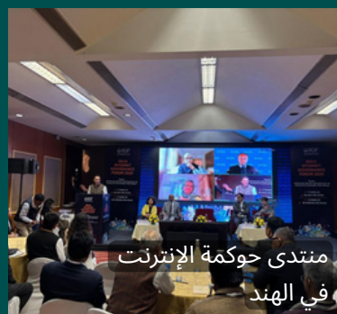
منتدى حوكمة الإنترنت في الهند