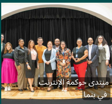
منتدى حوكمة الإنترنت في بنين