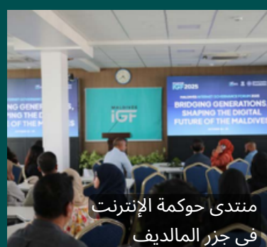
منتدى حوكمة الإنترنت في جزر المالديف