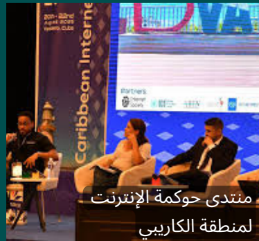
منتدى حوكمة الإنترنت لمنطقة الكاريبي