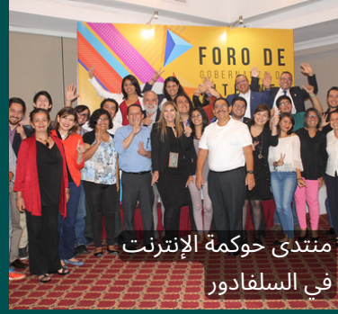
منتدى حوكمة الإنترنت في الفلبين