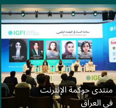
منتدى حوكمة الإنترنت في العراق