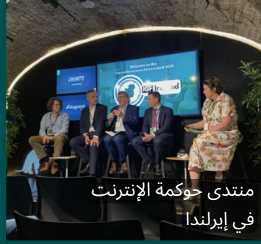
منتدى حوكمة الإنترنت في أيرلندا