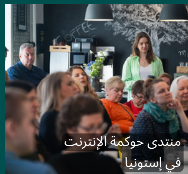
منتدى حوكمة الإنترنت في إستونيا