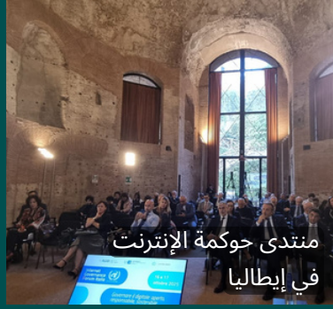
منتدى حوكمة الإنترنت في إيطاليا