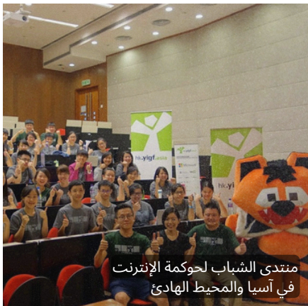
منتدى الشباب لحوكمة الإنترنت في آسيا والمحيط الهادئ

الأثر الملموس: ساهمت هذه التعاونات في ضمان مشاركة البرلمانات في أنشطة منتدى حوكمة الإنترنت، مع تعزيز الوعي بنموذج حوكمة الإنترنت القائم على تعدد أصحاب المصلحة داخل المؤسسات التشريعية. كما يشهد هذا النوع من الانخراط تزايدًا في مناطق أخرى، حيث توفر مبادرات المنتديات الوطنية والإقليمية ودون الإقليمية ومبادرات الشباب (NRIs) منصات محايدة للحوار حول قضايا السياسات الرقمية الناشئة، بما في ذلك الذكاء الاصطناعي، وتدفقات البيانات العابرة للحدود، والهوية الرقمية، والسلامة على الإنترنت.