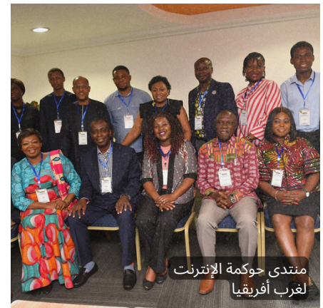
منتدى حوكمة الإنترنت لغرب أفريقيا