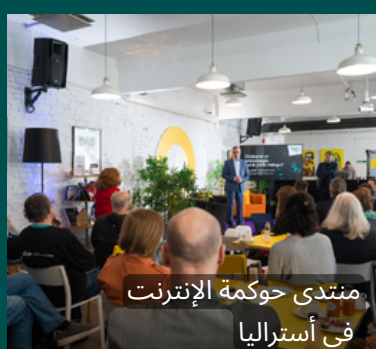
منتدى حوكمة الإنترنت في أستراليا