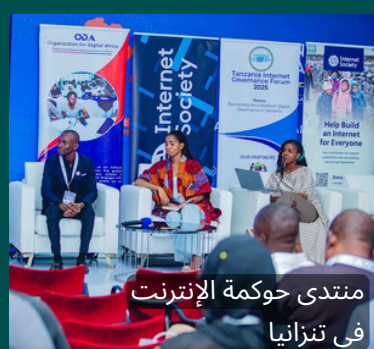
منتدى حوكمة الإنترنت في تنزانيا