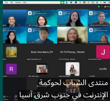
منتدى الشباب لحوكمة الإنترنت في جنوب شرق آسيا